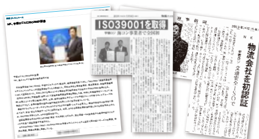
マスコミ各紙に取り上げられました